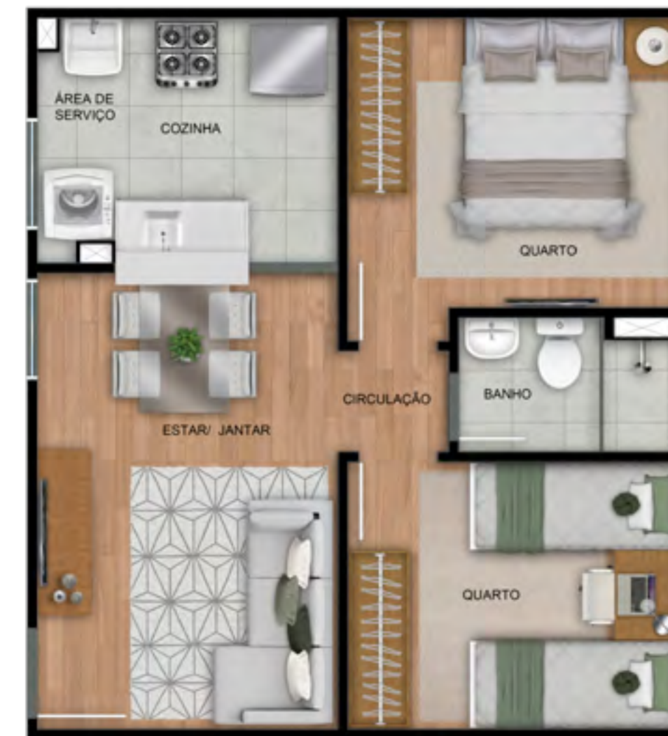
APTO 203 | BLOCO 5