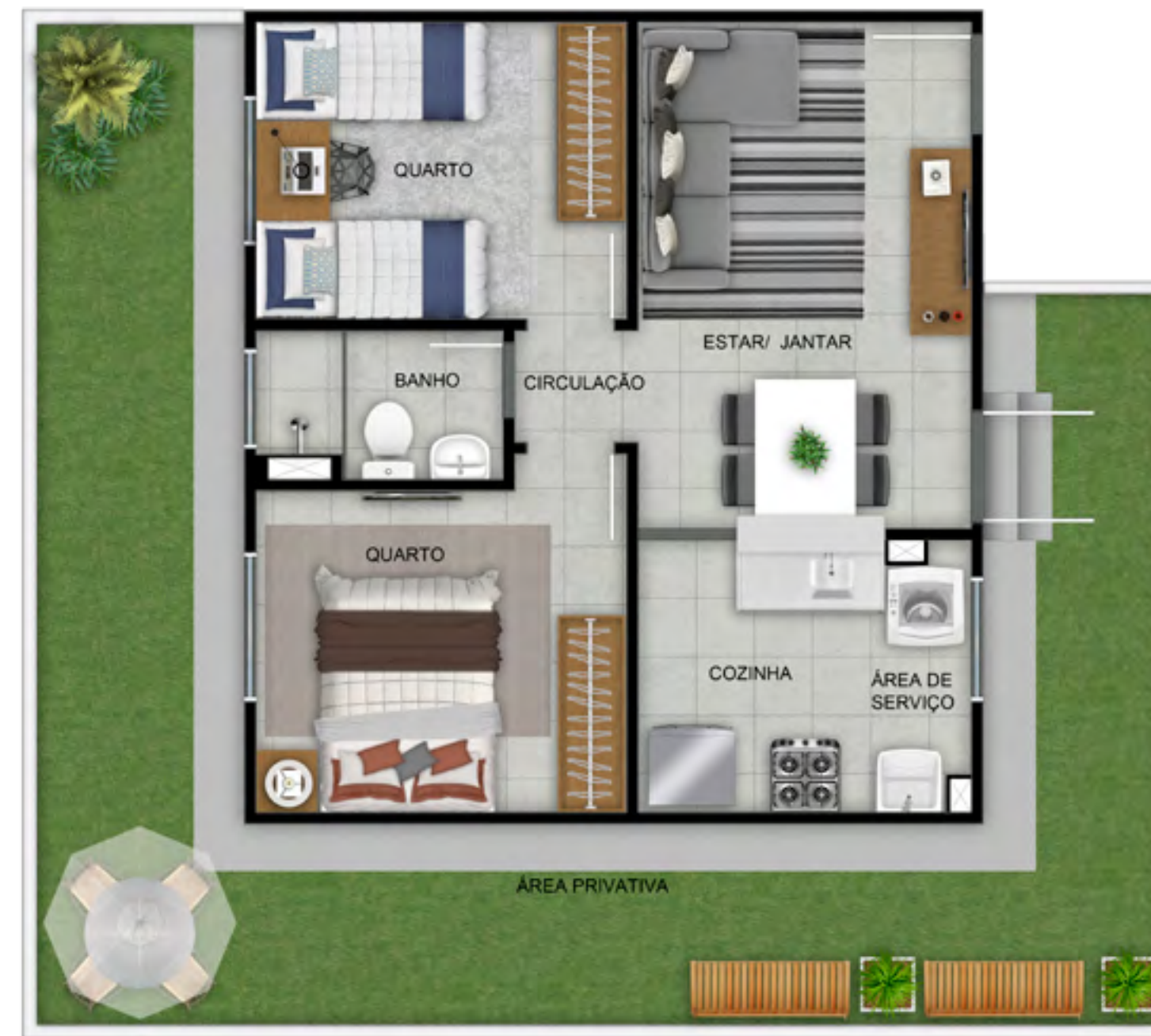
APTO 102 | BLOCO 11

Espaços na medida da sua comodidade e até com opção de área privativa.