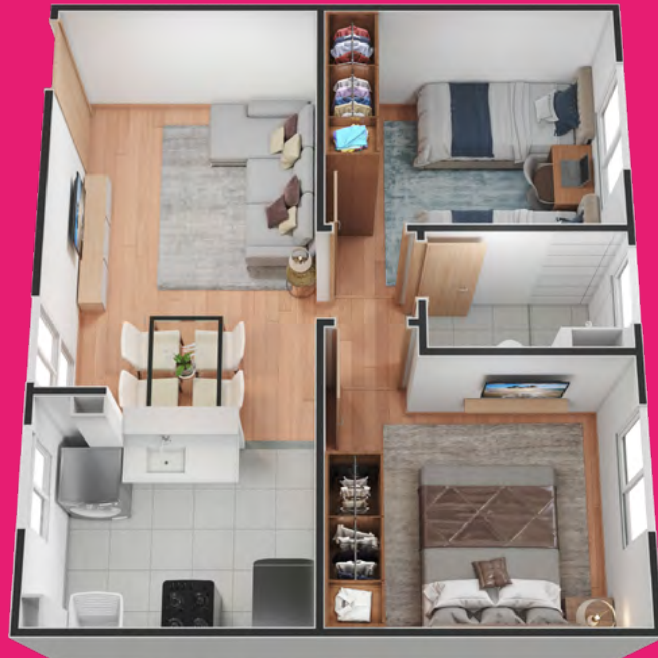
APTO 204 | BLOCO 5