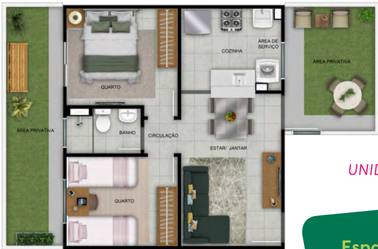
APTO 101 | BLOCO 7